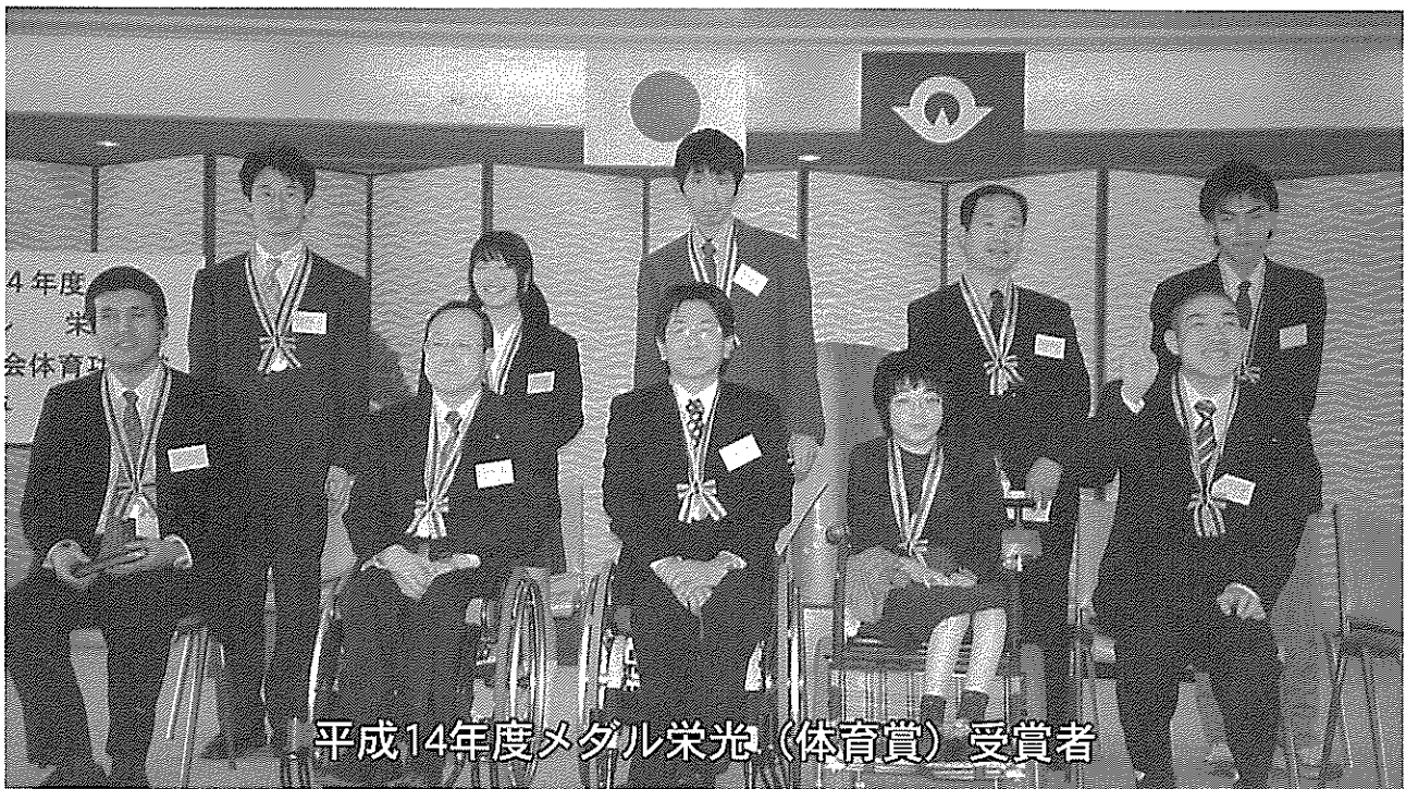
平成14年度メダル栄光（体育賞）受賞者

山口市大手町9-6（山口県社会福祉会館2F） TEL 083-901-4065 FAX 083-901-4065 http://www9.ocn.ne.jp/~s-skyo35/ E-mail : s-spokyo35@crux.ocn.ne.jp