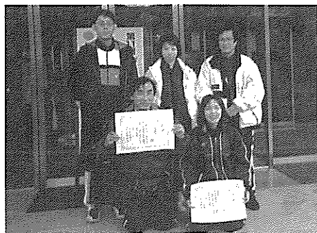
優勝したメンバー